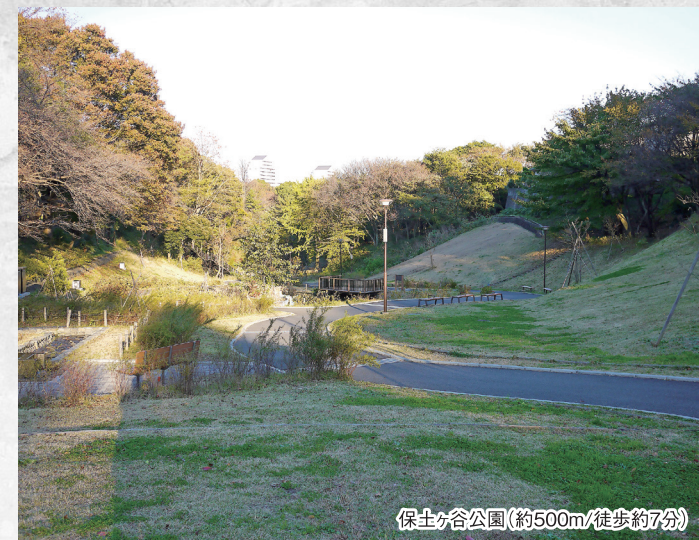
保土ヶ谷公園(約500m/徒歩約7分)