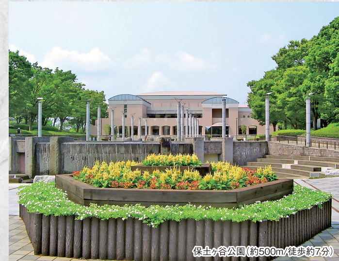
保土ヶ谷公園(約500m/徒歩約7分)