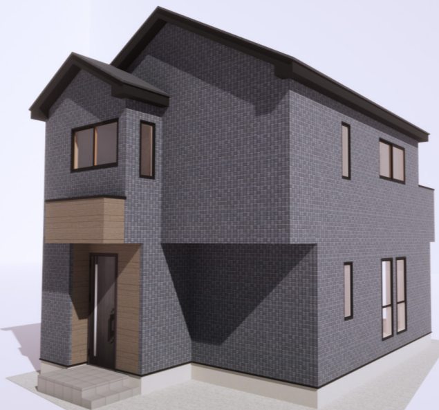
※図面を基に描き起こしたものであり、実際とは変更になる場合がございます。