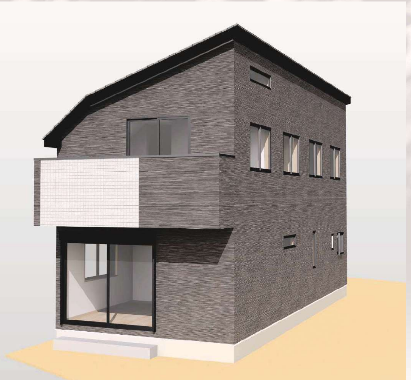
〈外観完成予想図〉 ※本CGは設計図面を基に作成したものであり、細部については省略されているものとなります。色感・質感について現状と異なる場合があります。